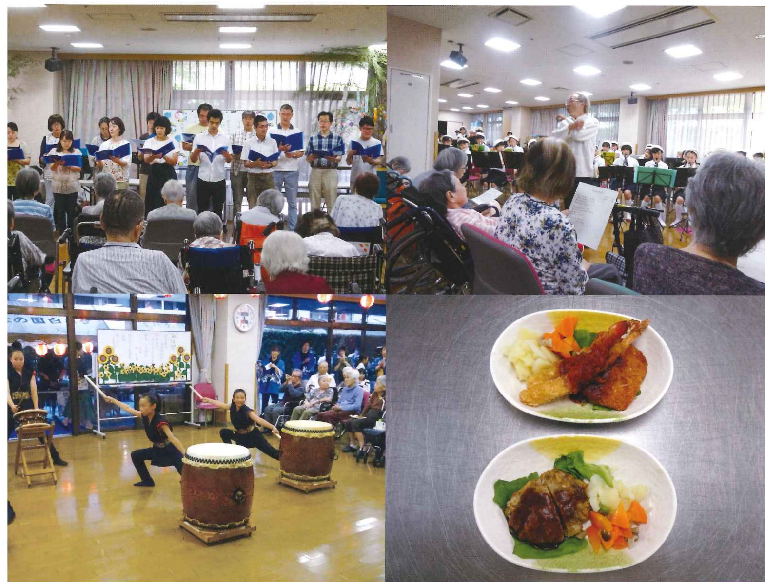
写真▶左上：七夕 右上：南白糸台小学校 左下：納涼祭 右下：選択食