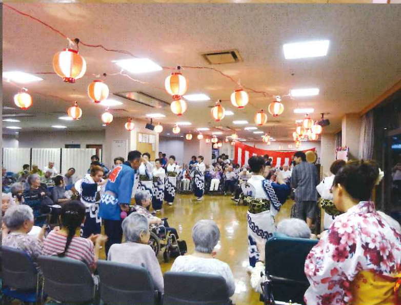
写真▶左上：端午の節句 右上：南白小交流会 左下：七夕 右下：納涼祭