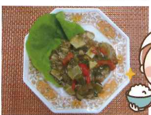
▶海老といかのチリソース