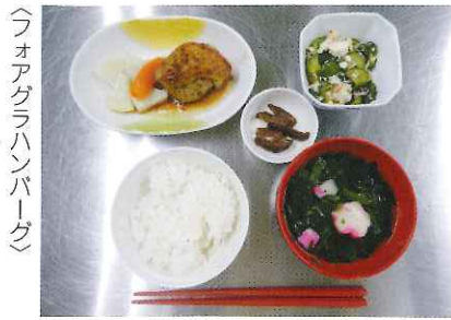
フォアグラハンバーグ

フォアグラハンバーグと、うなとろ丼です。どちらも魅力的なメニューなので美味しそうで皆様決めがたかったでしょうが、なんと見事に引き分けとなりました。