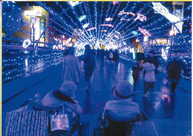
写真▶左上：文化祭 右上：お祝い善 左下：クリスマス会 右下：イルミネーション